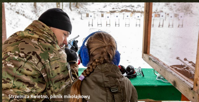
Strzelnica Kwietno, piknik mikołajkowy