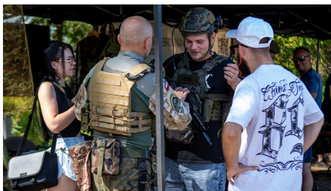
Strzelnica Żmigród, piknik strzelecki