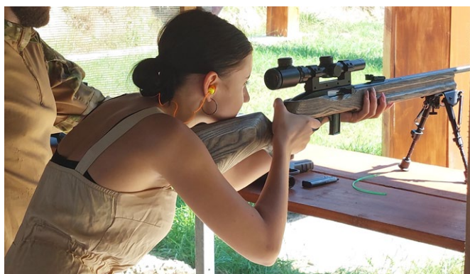
Strzelnica Żmigród, piknik strzelecki