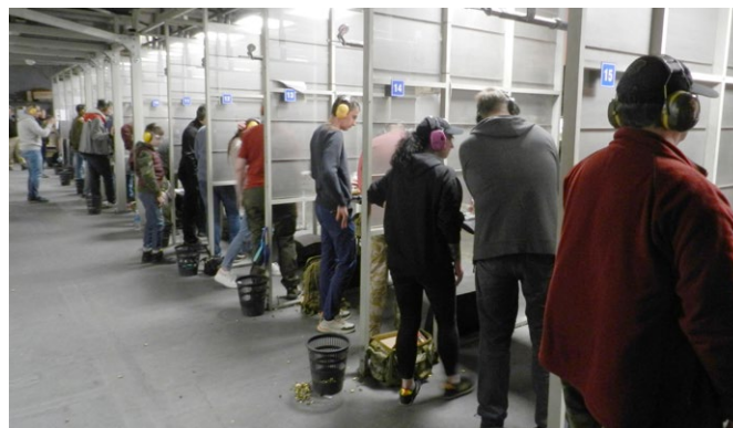
Strzelnica Warszawa, zajęcia strzeleckie

Obiekt na 10 stanowisk zapewni wysokiej jakości, wygodne zajęcia dla kilkudziesięciu tysięcy chętnych rocznie.