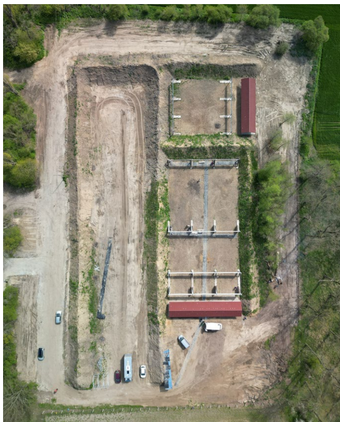
Strzelnica Żmigród z lotu ptaka