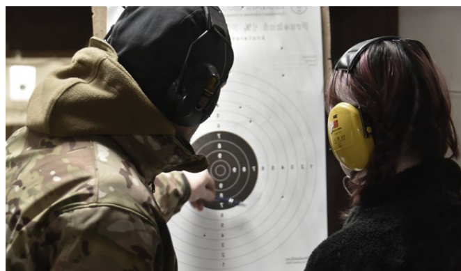
Strzelnica Warszawa, zajęcia dla młodzieży

Organizacja dysponuje budżetem od 150 tys. do 2 mln zł na budowę, w zależności od lokalizacji, gęstości zaludnienia i typu strzelnicy. Mamy fachową wiedzę i wieloletnie doświadczenie na różnych obiektach, w tym czterech strzelnicach będących własnością lub w bezpośrednim zarządzie KS Amator.