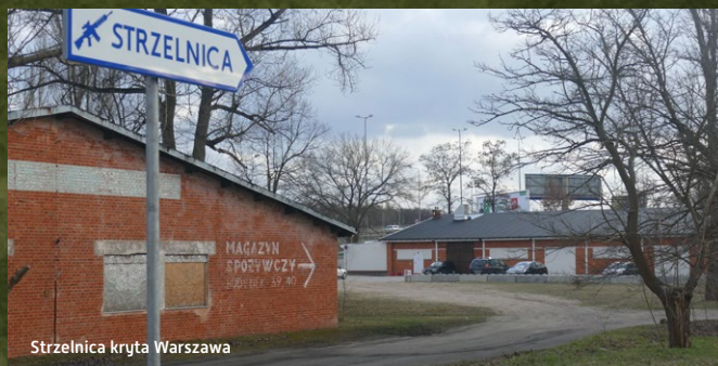
Strzelnica kryta Warszawa

Nasze obiekty projektujemy samodzielnie, także sami dbamy o wykonanie, posiłkując się wyspecjalizowanymi firmami.