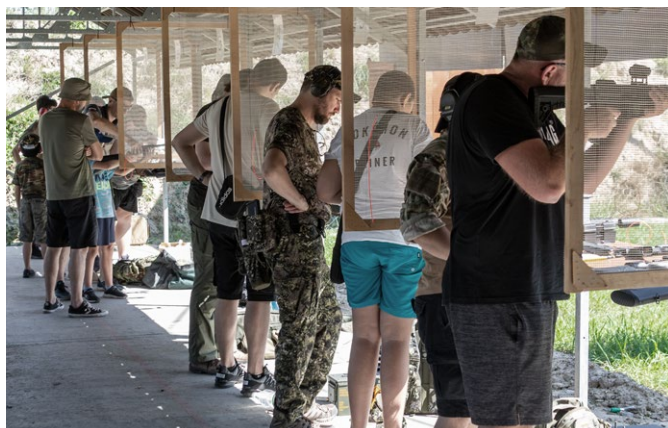
Strzelnica Żmigród, zajęcia strzeleckie

Powtórzmy wspólnie sukces Żmigrodu, który zdecydował się na inwestycję z naszym stowarzyszeniem. Gmina znalazła działkę w optymalnym dla mieszkańców miejscu, sprzedała ją nam z bonifikatą 90% i pomogła z uzyskaniem warunków zabudowy obiektu sportowego. W efekcie z budżetu gminy nie ubyła ani złotówka, a mieszkańcy Żmigrodu i okolic cieszą się dzisiaj dużą, nowoczesną strzelnicą. Korzystają z niekomercyjnych, otwartych zajęć, treningów oraz wielu imprez i wydarzeń. Zgodnie z umową, gmina ma prawo weryfikacji planów przedsięwzięć organizowanych na strzelnicy.